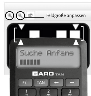
Abb. 4: optische Übertragung